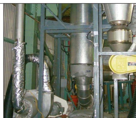
Secador Vertical Flash ou Calcinação a Baixa Temperatura

Venha testar seus produtos na PLANTA PILOTO da Crown.