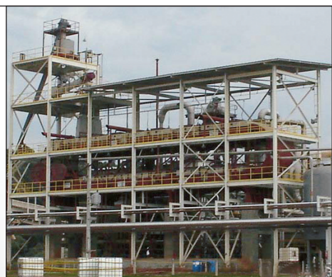
Extrator de percolação Modelo III, SPC

Extrator de percolação Modelo III: Para extrações de grandes volumes, como Proteínas Vegetais, cavaco de madeira, polímeros ou outros produtos com boa drenagem.