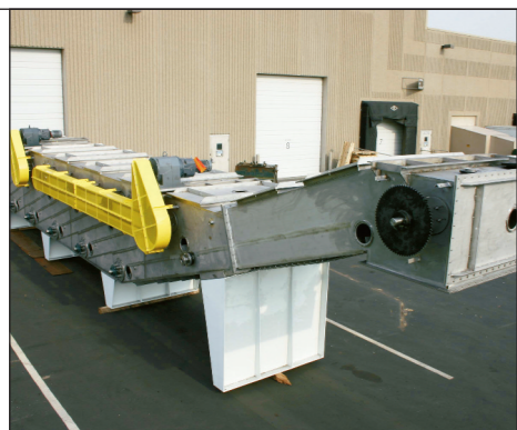
Extrator de Imersão Modelo IV