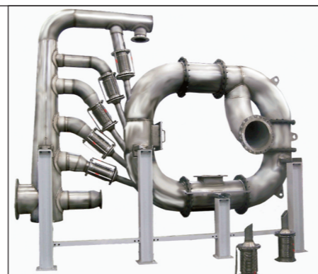
Moinho Secador Flash