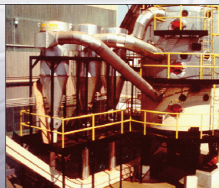
DTDC Dessolventizador Secador/Resfriador