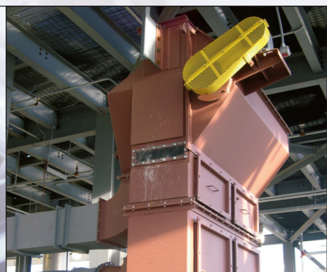
Aspirador em Cascata