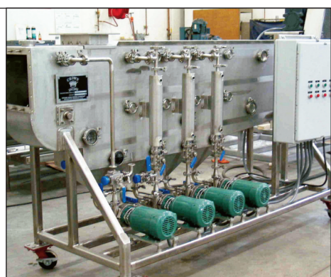
Extrator sólido / líquido Modelo V

Extrator de percolação Modelo V: Para flocos, grãos triturados ou materiais diversos.