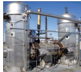
CONDENSAÇÃO A FRIO (ICE CONDENSING)